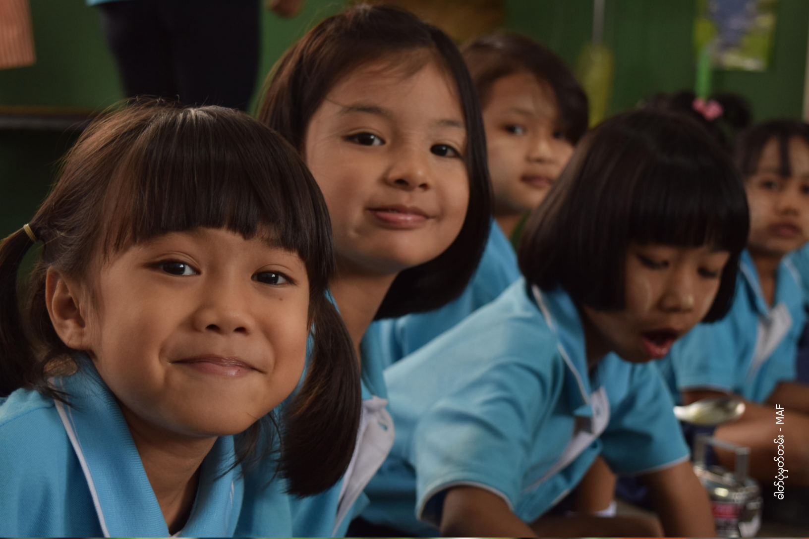
ခါးပုံပုံဆွဲခြင်း - MAF