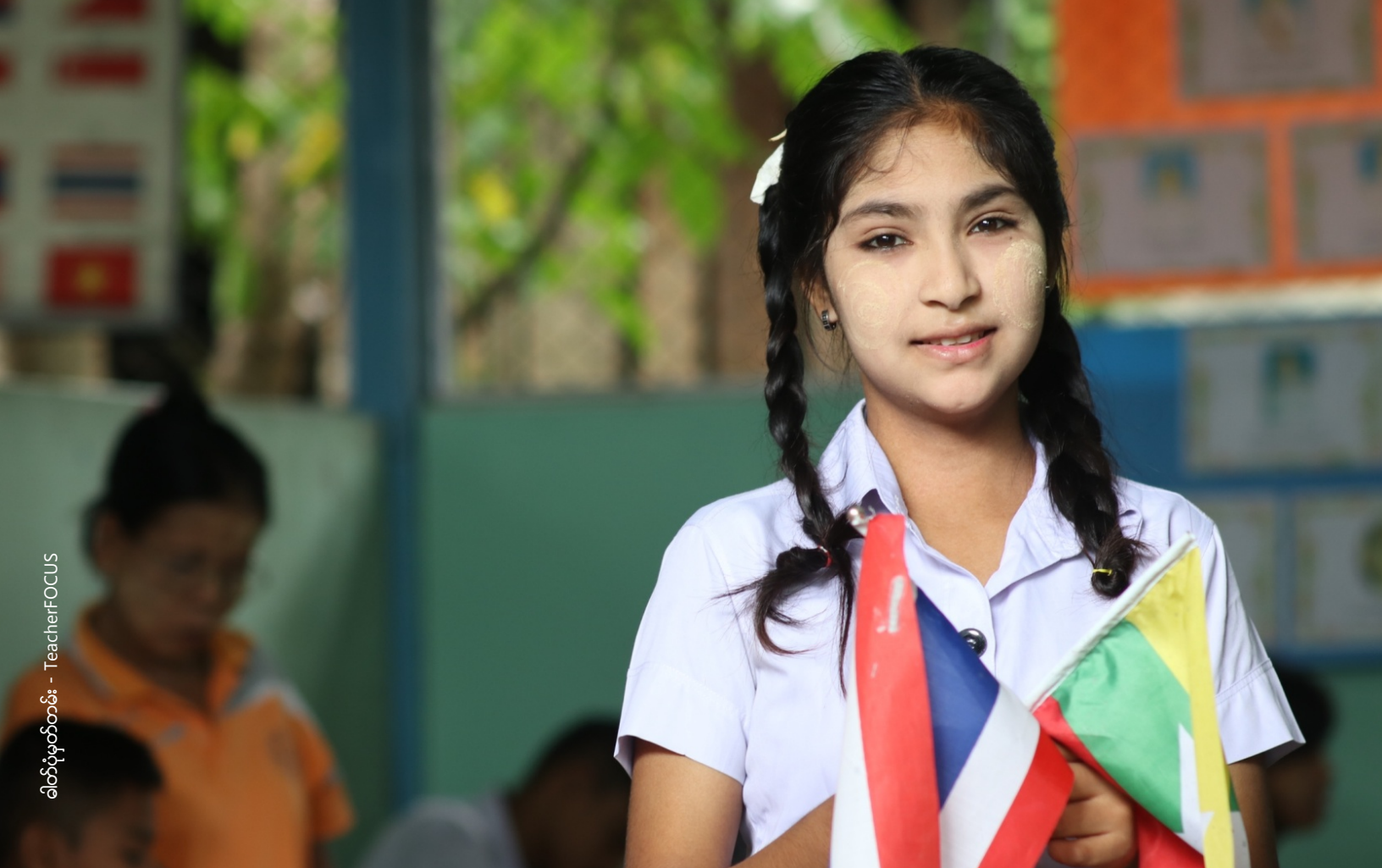
ခါးပုံပုံဆွဲခြင်း - TeacherFOCUS